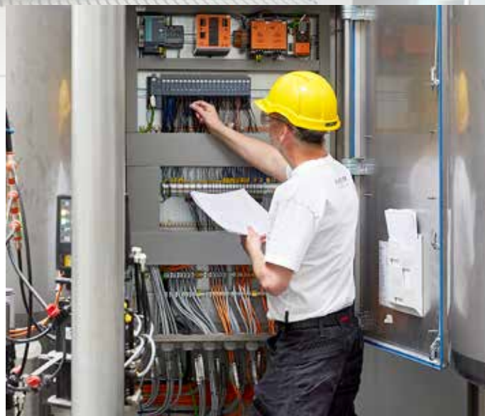
Gennemgang af tavle