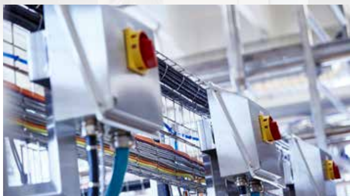
Kører netværket optimalt?